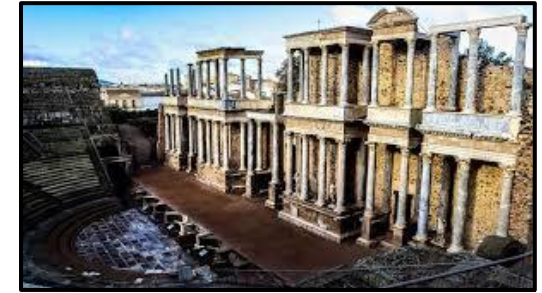
Teatro Romano, Mérida