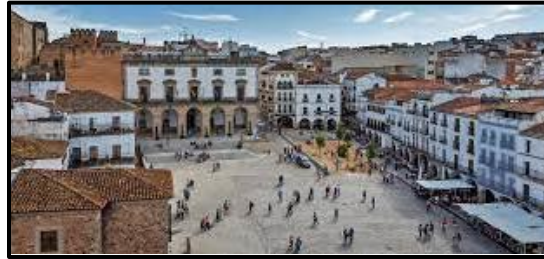
La Plaza Mayor, Cáceres