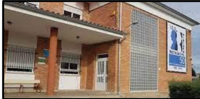
IES Loustau Valverde