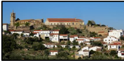
Valência de Alcântara